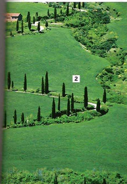
1. La costa trapanese offre spiagge dove si può già prendere il sole. 2. Il panorama della Val d'Orcia ci viene invidiato da tutto il mondo. 3. Perugia è un museo a cielo aperto (nella foto piazza IV Novembre con il palazzo dei Priori).