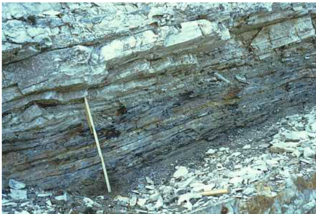
Un dettaglio del livello Bonarelli alla Roccaccia, M. Nerone

Il sedimento basale (scaglia bianca) è un calcare di colore bianco-grigiastro, che sfuma verso il rosa-arancio (scaglia rossa) in prossimità della cresta; tra le due colorazioni appare netta, perfettamente definita e disposta parallelamente alle altre stratificazioni una “fascia” grigio scuro, a tratti nera, a testimonianza di un’avvenuta soluzione di continuità nel processo di sedimentazione del fondo