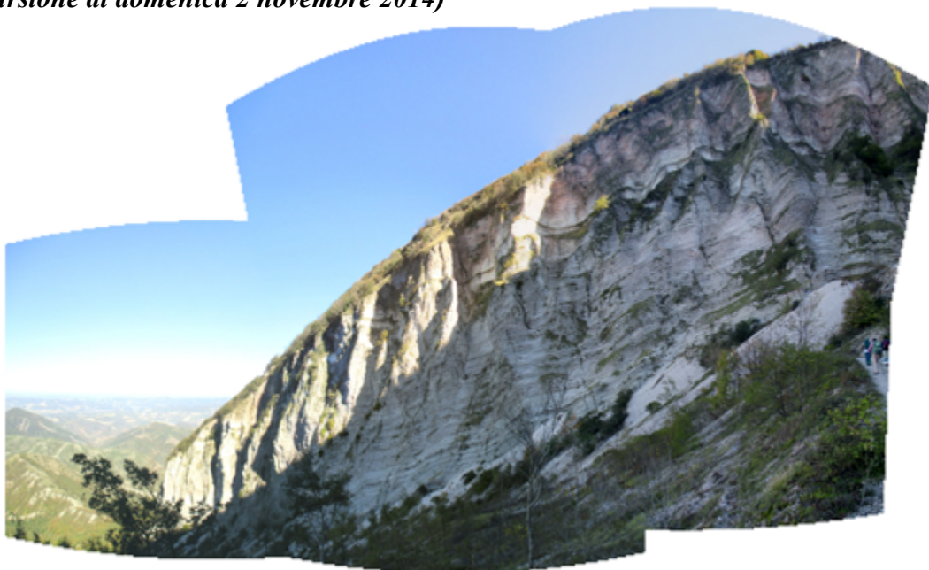
Livello Bonarelli, La Montagnola-M. Nerone: nel quadrante di destra in sequenza dal basso la scaglia bianca, il livello Bonarelli e la scaglia rossa.

Il cartello giallo con la scritta "fosso dell'Ere-remo" appare quasi improvvisamente al margine della Provinciale 257 qualche chilometro ad Est di Piobbico, subito dopo aver superato una stretta curva che la strada è costretta a disegnare per aggirare il punto di confluenza (un'ansa a forma di cappio), dove il Fosso dell'Ere-remo si getta nel torrente Candigliano, un corso d'acqua che in alcune cartografie è riportato con l'altisonante appellativo di "fiume".