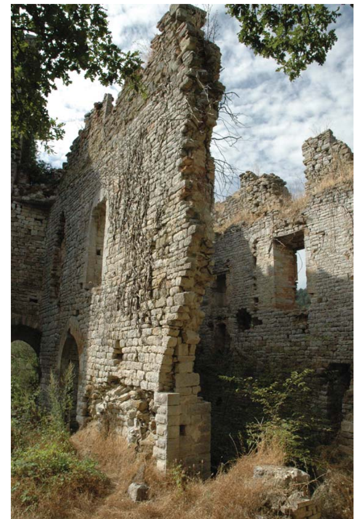
Testi di Paolo Passerini Elaborazione cartografica di Mauro Bifani Grafica e foto di Francesco Brozzetti

Da qui, ormai il più è fatto, basta rifare la strada dell'andata e si ritorna al parcheggio del Parco.